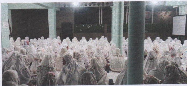
Gambar 2. Kegiatan shalat tahajud menunggu imam dimushola al-asyiqiyah