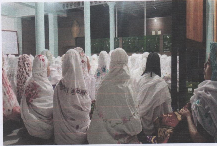
Gambar 3. Kegiatan shalat tahajud di mushola al-asyqiyah