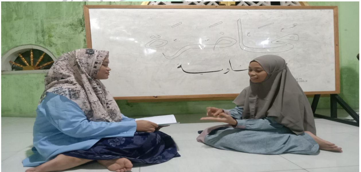
Wawancara bersama pengurus putri pondok pesantren Al Ma'ruf