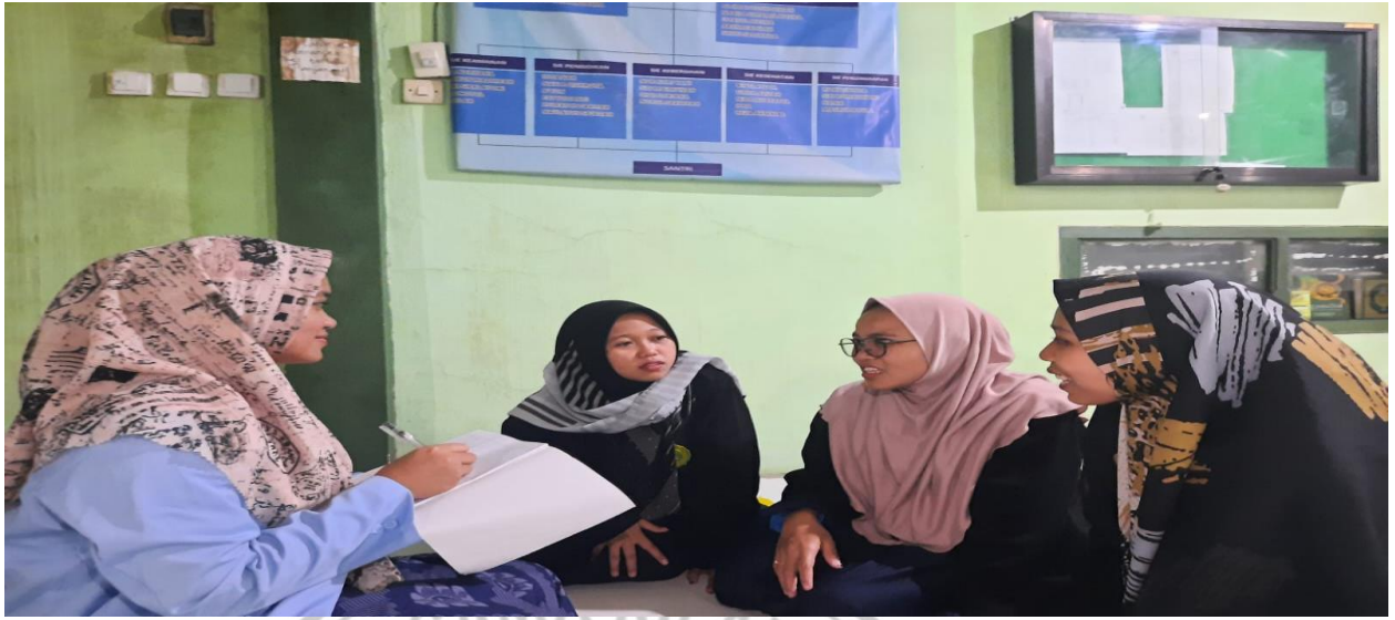
Wawancara bersama Santri putri pondok pesantren Al Ma'ruf