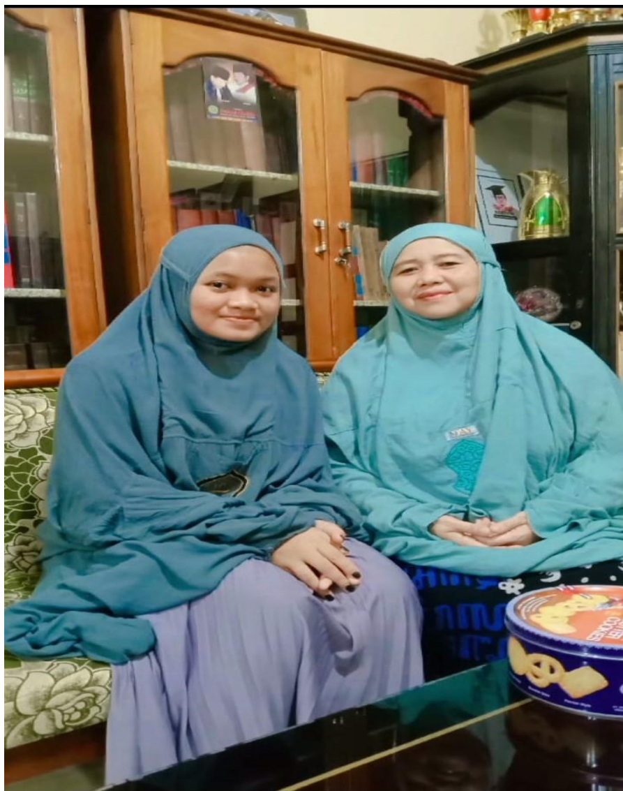
Wawancara Bersama pengasuh pondok pesantren Al Ma'ruf