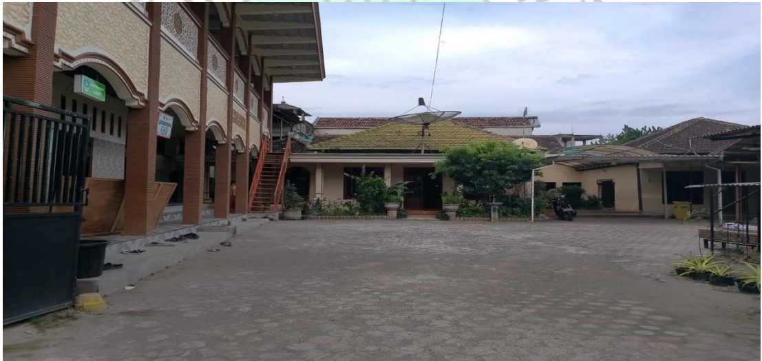
Bangunan pondok pesantren Al-Ma'ruf