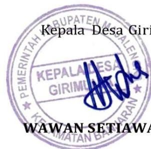
WAWAN SETIAWAN, S.Sos

Demikian surat izin ini kami kami buat. Atas kerjasamanya kami haturkan terima kasih.