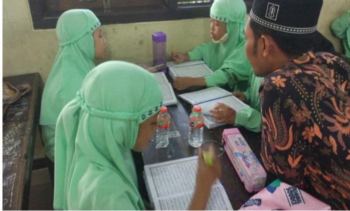
FOTO KEGIATAN DI TPQ TARBIYATUL MUBTADI-IEN