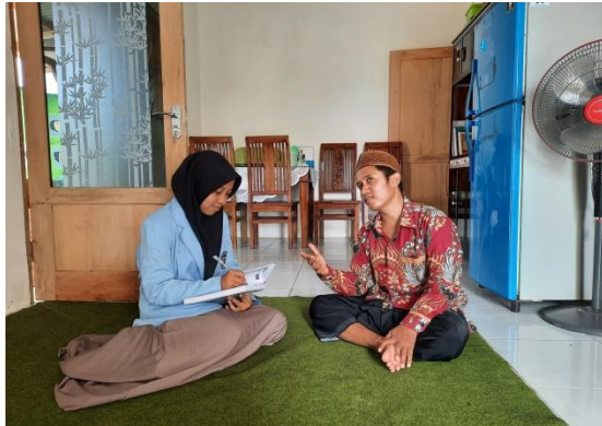
Wawancara dengan Penanggung Jawab Program