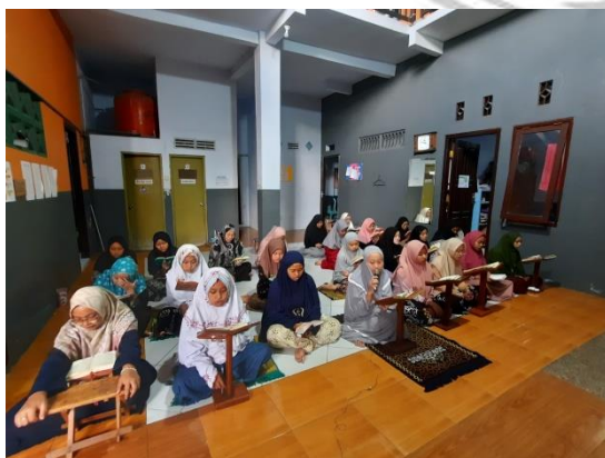
Kegiatan Habitiasi Muroqobah 5 Juz