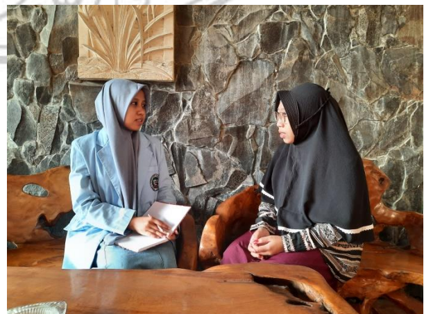
Wawancara dengan Inisiator Program