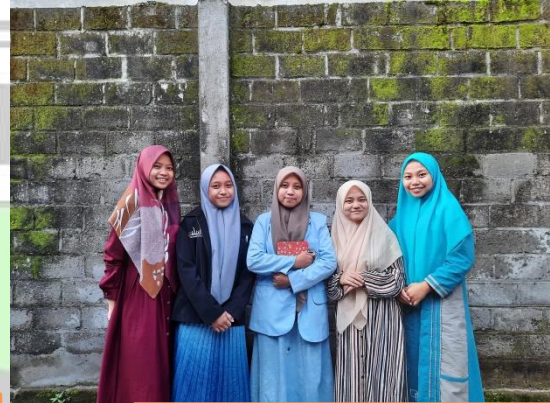
Bersama Ustazah dan Santri