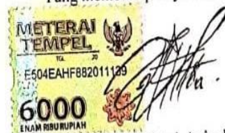
Sulis Nurul Afifatul Azizah