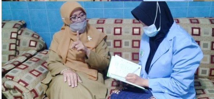
Gambar diambil pada tanggal 16 Maret 2021