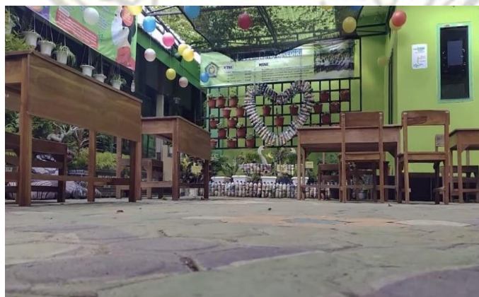
Gambar diambil pada tanggal 10 Maret 2021