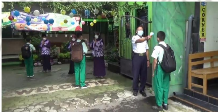
Gambar diambil pada tanggal 10 Maret 2021