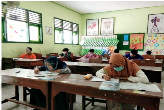
Gambar diambil pada tanggal 16 Maret 2021