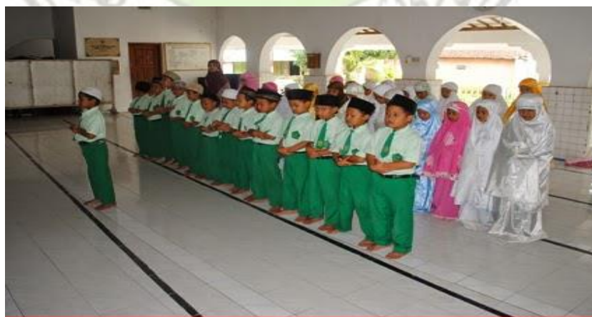
Gambar diambil pada tanggal 30 Maret 2021