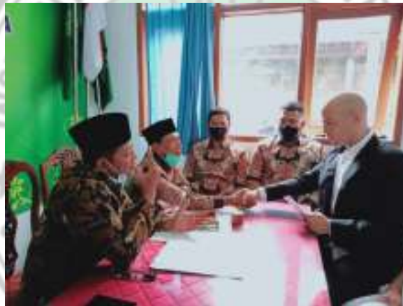
Gambar 4. Pelaksanaan Perkawinan Campuran