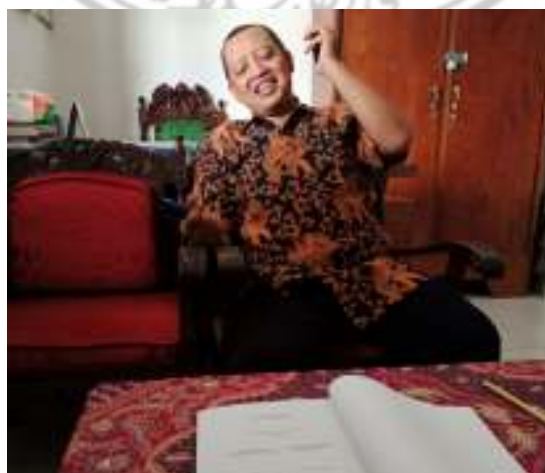
Gambar. 5 Proses wawancara dengan Kepala KUA Mojoroto