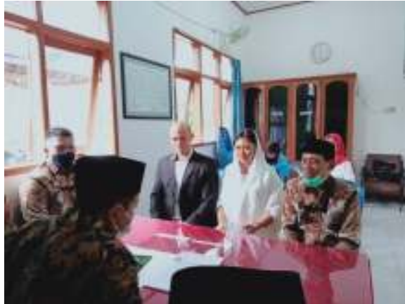
Gambar 3. Perkawinan Campuran WNA asal USA