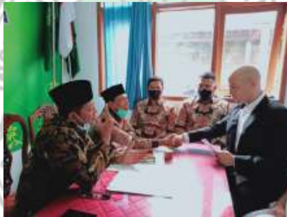
Gambar 4. Pelaksanaan Perkawinan Campuran