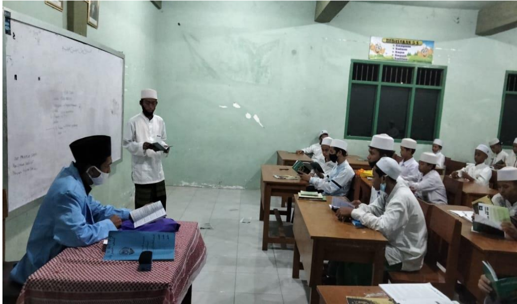
Proses pembelajaran di kelas