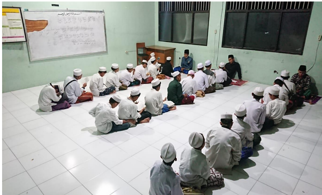
Evaluasi hafalan (Muhafadzoh)