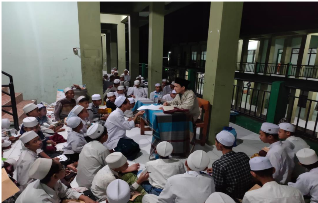
Pengajian kitab diluar jam KBM