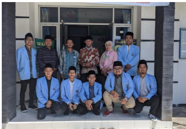
Gambar 2. Proses wawancara dengan Pengurus KUA Mojoroto