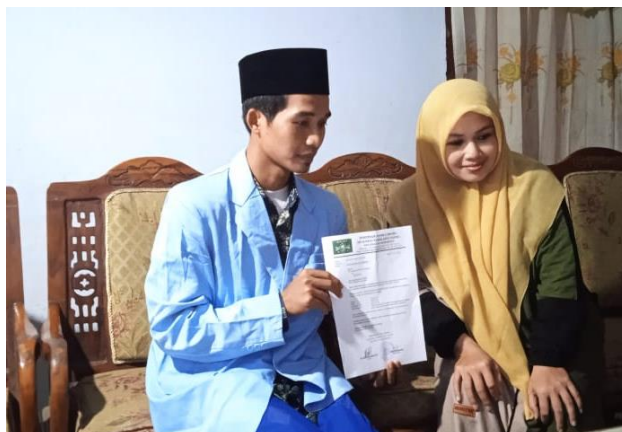
Gambar 3. Proses wawancara dengan Ketua Muslimat NU Mojoroto