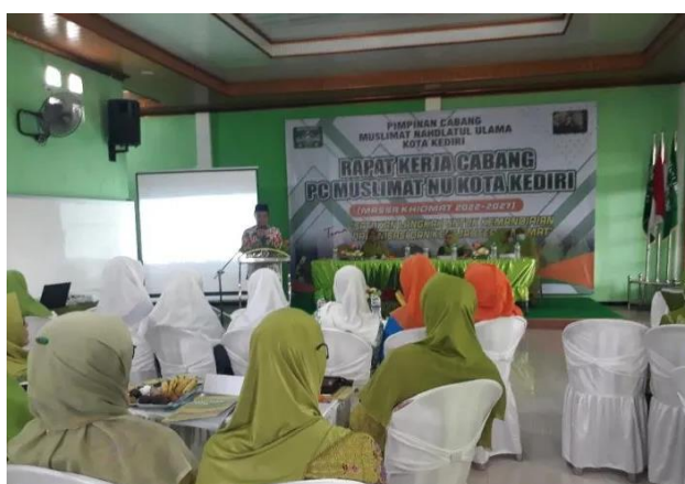
Gambar. 4 Dokumentasi Muslimat NU Mojoroto