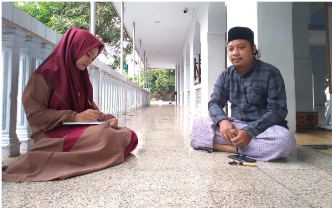
Gambar 2. Wawancara dengan Ustadz Pondok Pesantren Salafiyah