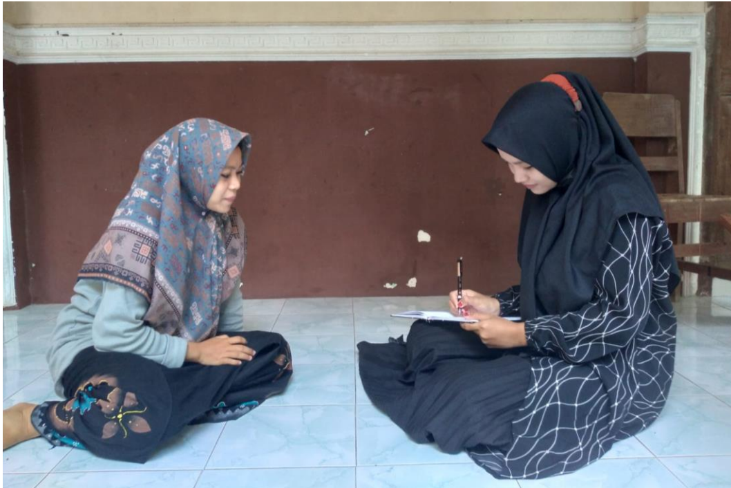
Gambar 5. Wawancara dengan Ustadzah Pondok Pesantren Salafiyah