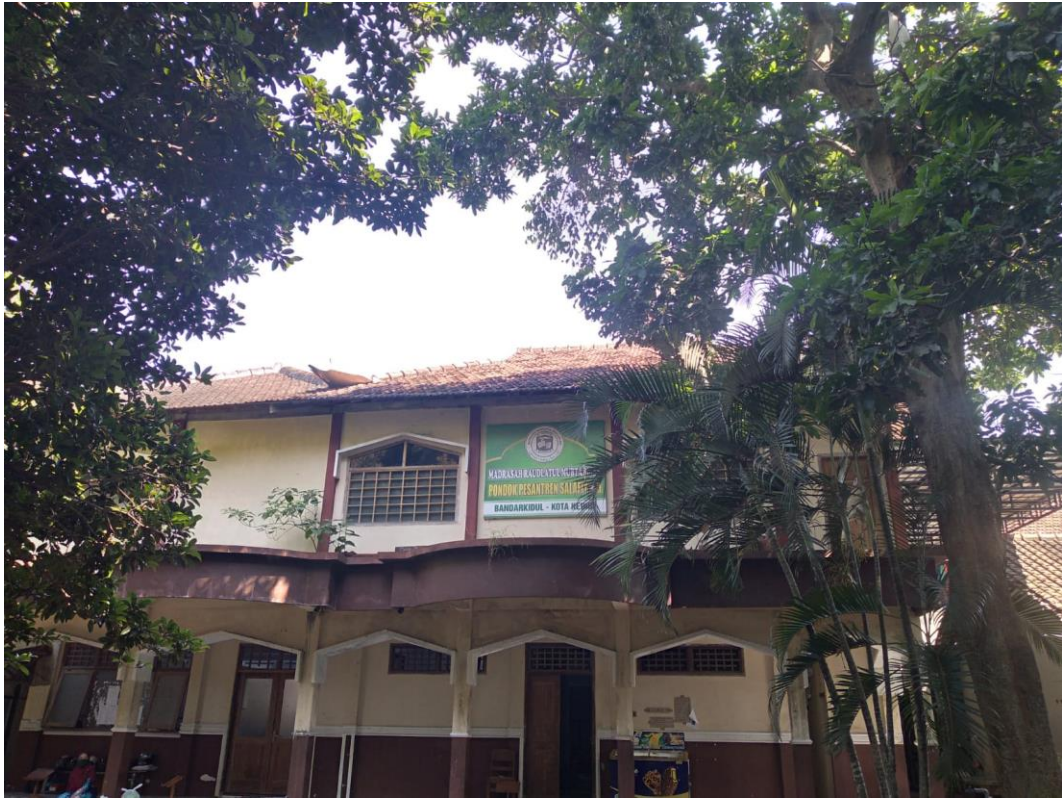
Gambar 3. Pondok Pesantren Salafiyah