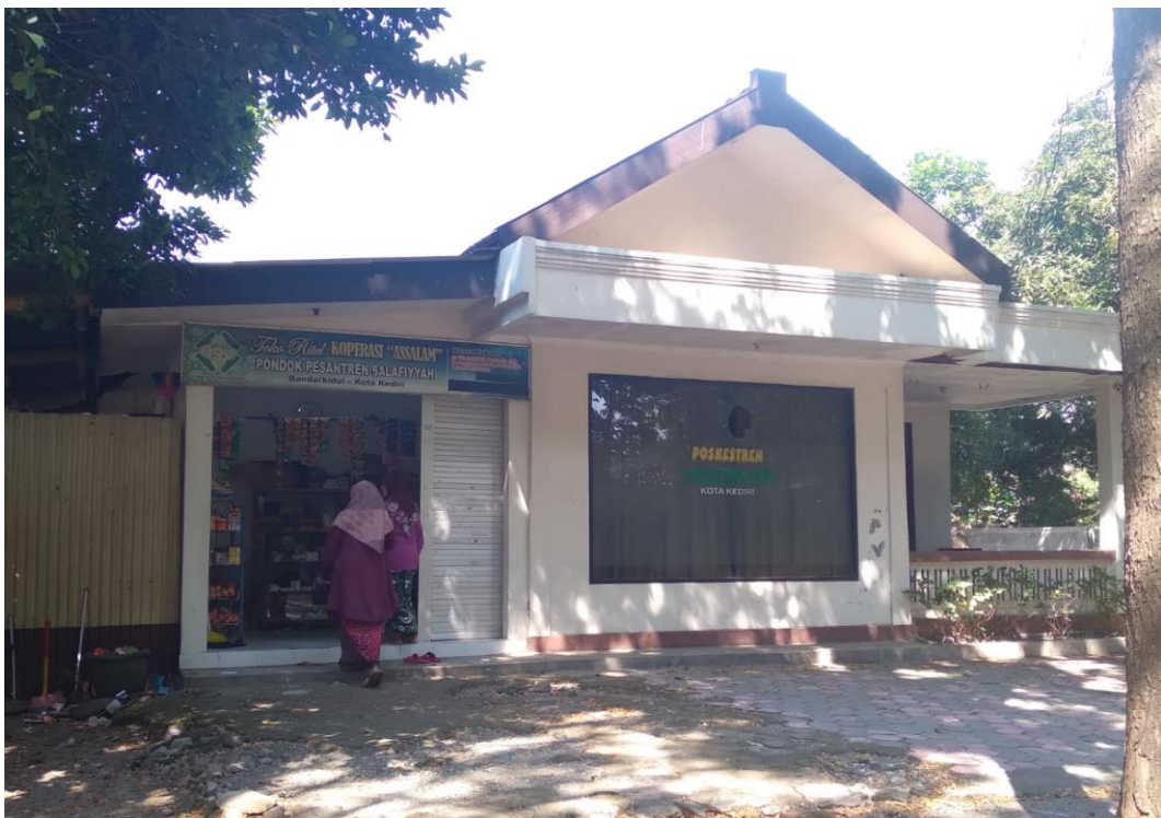
Gambar 8. POSKESTREN dan Koperasi Pondok Pesantren Salafiyah