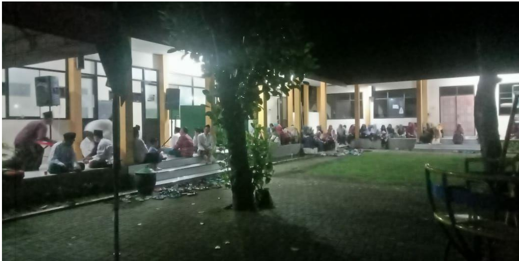
Gambar 9. Kegiatan Pengajian Bandongan Pondok Pesantren Salafiyah