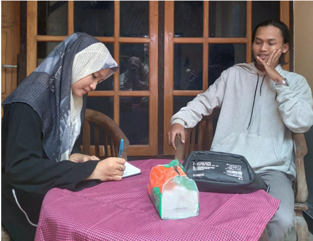
Gambar 7. Wawancara dengan Pengurus Pondok Pesantren Salafiyah