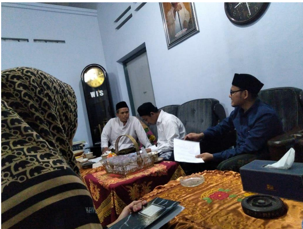
Gambar 6. Wawancara dengan Ketua Pondok Pesantren Salafiyah