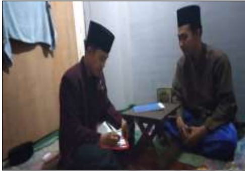
Wawancara Bersama Informan