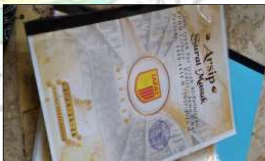
Buku Arsip Jam'iyah