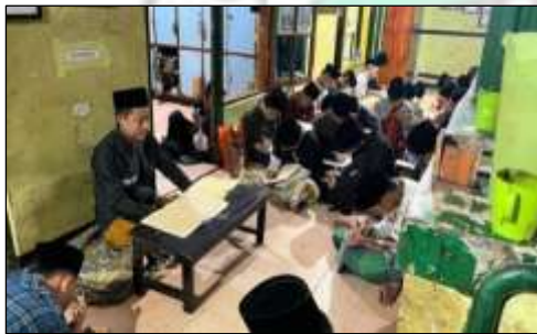
Pengajian Kitab Oleh Penasehat Jam'iyah