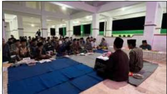
Bahtsu Masa'il Jam'iyah