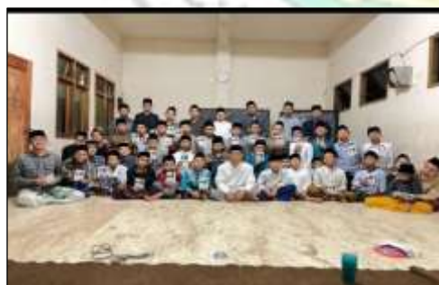
Bisba Santri Baru