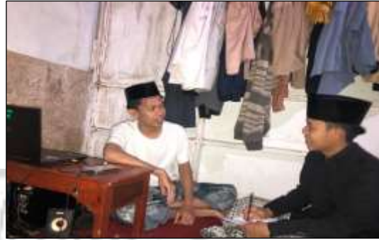
Wawancara Bersama Informan