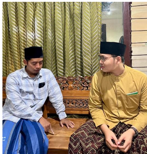
Wawancara Kepala Madrasah