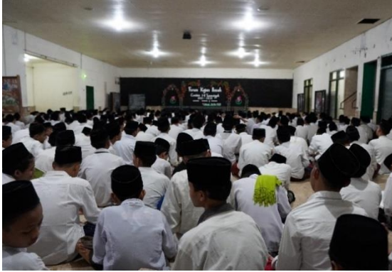
Kegiatan Murottalan Bersama