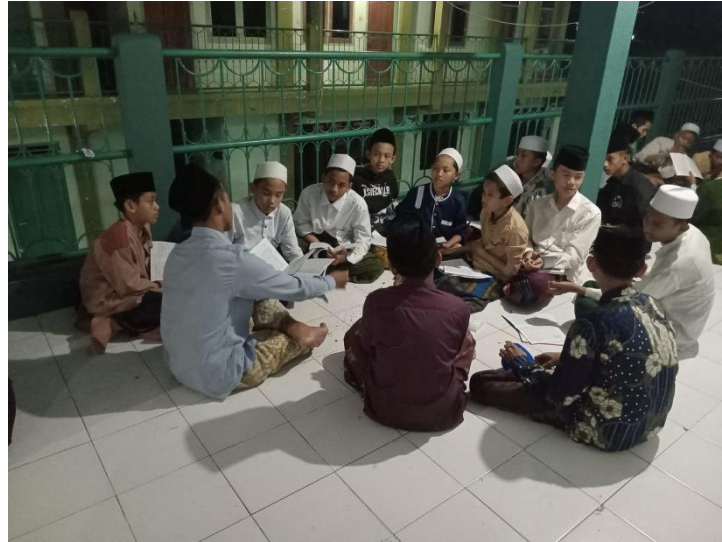
Kegiatan Pra Musyawarah V Ibtidaiyyah MADIN Al Mahrusiyah