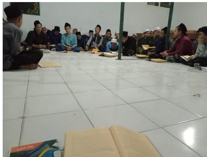
Kegiatan Musyawarah V Ibtidaiyyah MADIN Al Mahrusiyah