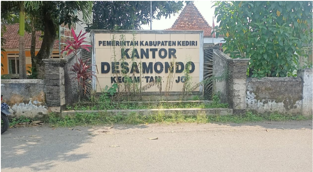
Gambar 3 Kantor Pemerintahan Desa Mondo