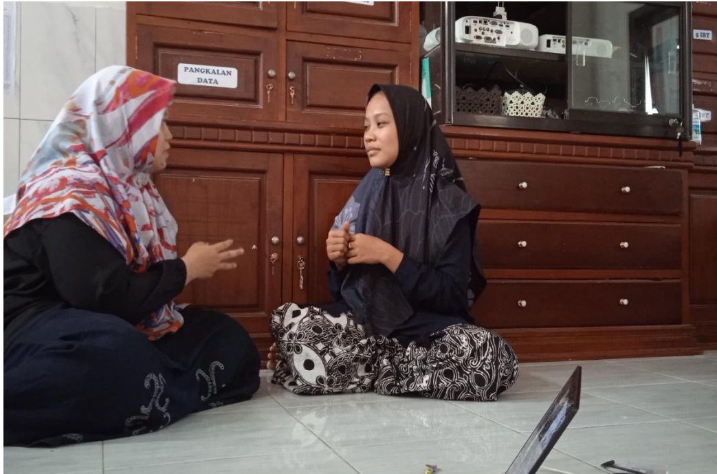
Gambar 1. Wawancara pengajar kitab Khulasoh Nurul Yaqin