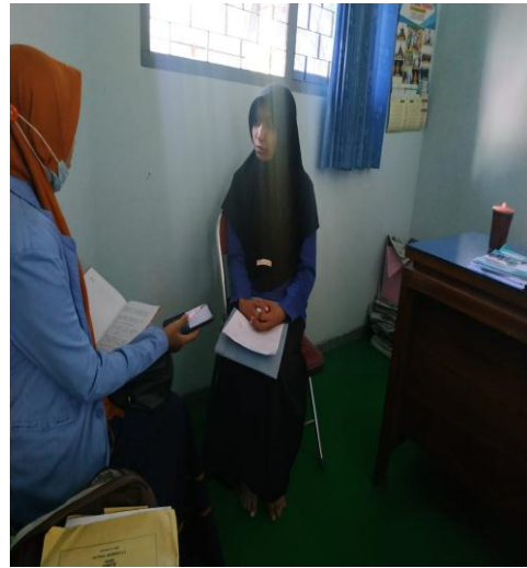
Kegiatan Wawancara dengan Waka Kurikulum MA Al Manar Prambon