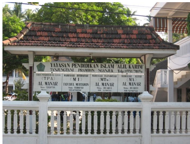
Gapura Depan MA Al Manar Prambon