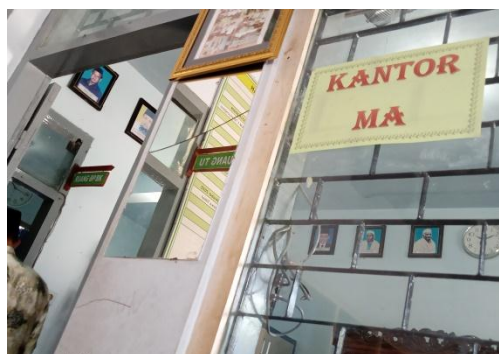
Kantor MA Al Manar Prambon