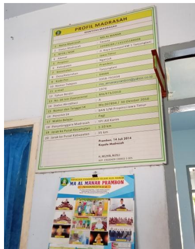
Identitas Madrasah/Profil Madrasah