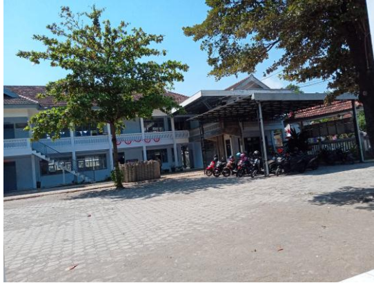
Halaman Depan MA Al Manar Prambon Nganjuk